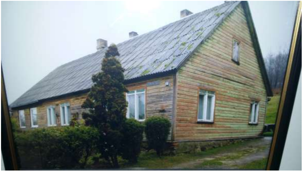
1920 m. spalio mėn. mokykla persikėlė į pastatą Vydūno g. 70. 1942–1943 m. išleista pirmoji Vilkijos gimnazistų laida.