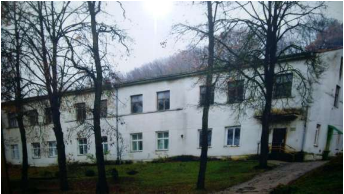
1963 m. mokyklai pastatytas naujas pastatas. Sovietmečiu buvo P. Cvirkos vidurinė mokykla. 2007 m. kovo 5 d. suteiktas gimnazijos statusas.